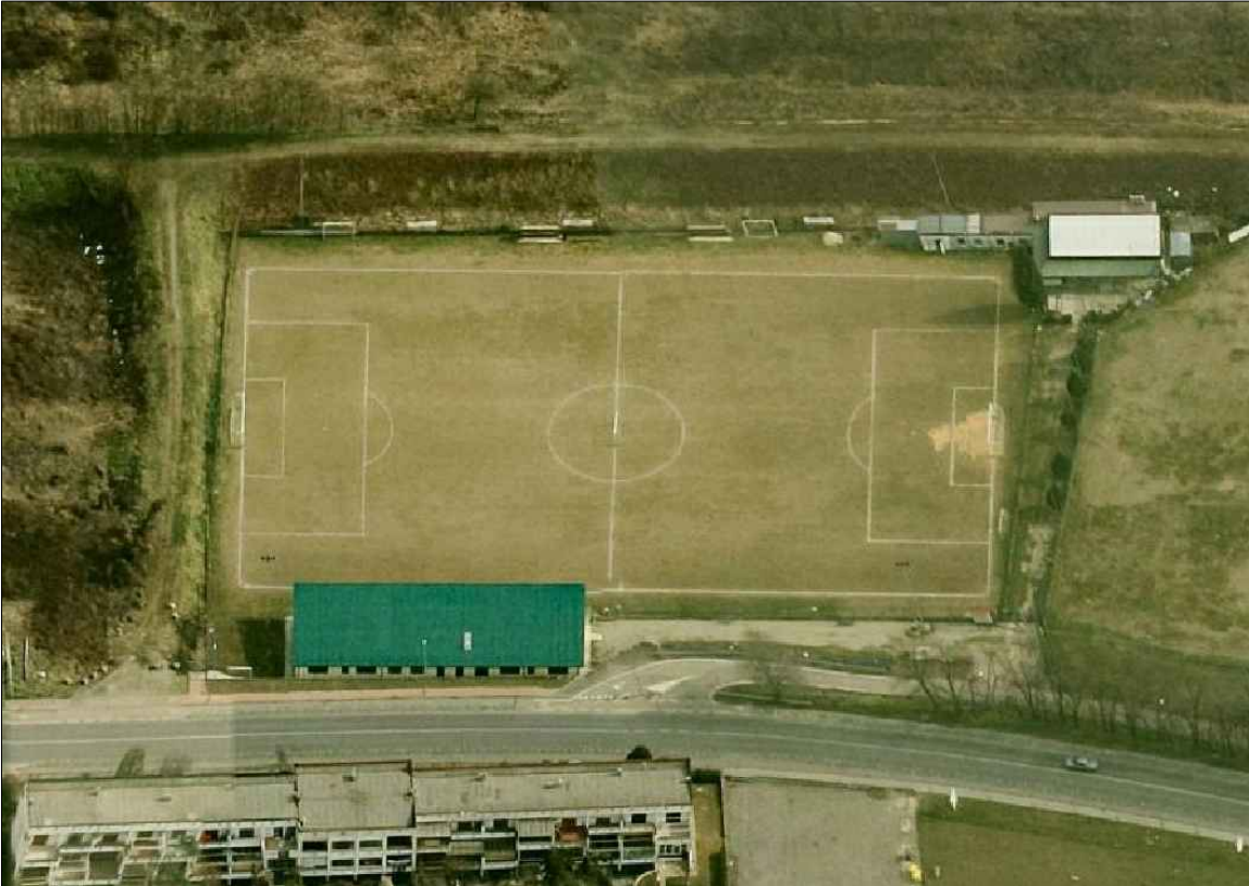
VISTA AEREA DA OVEST