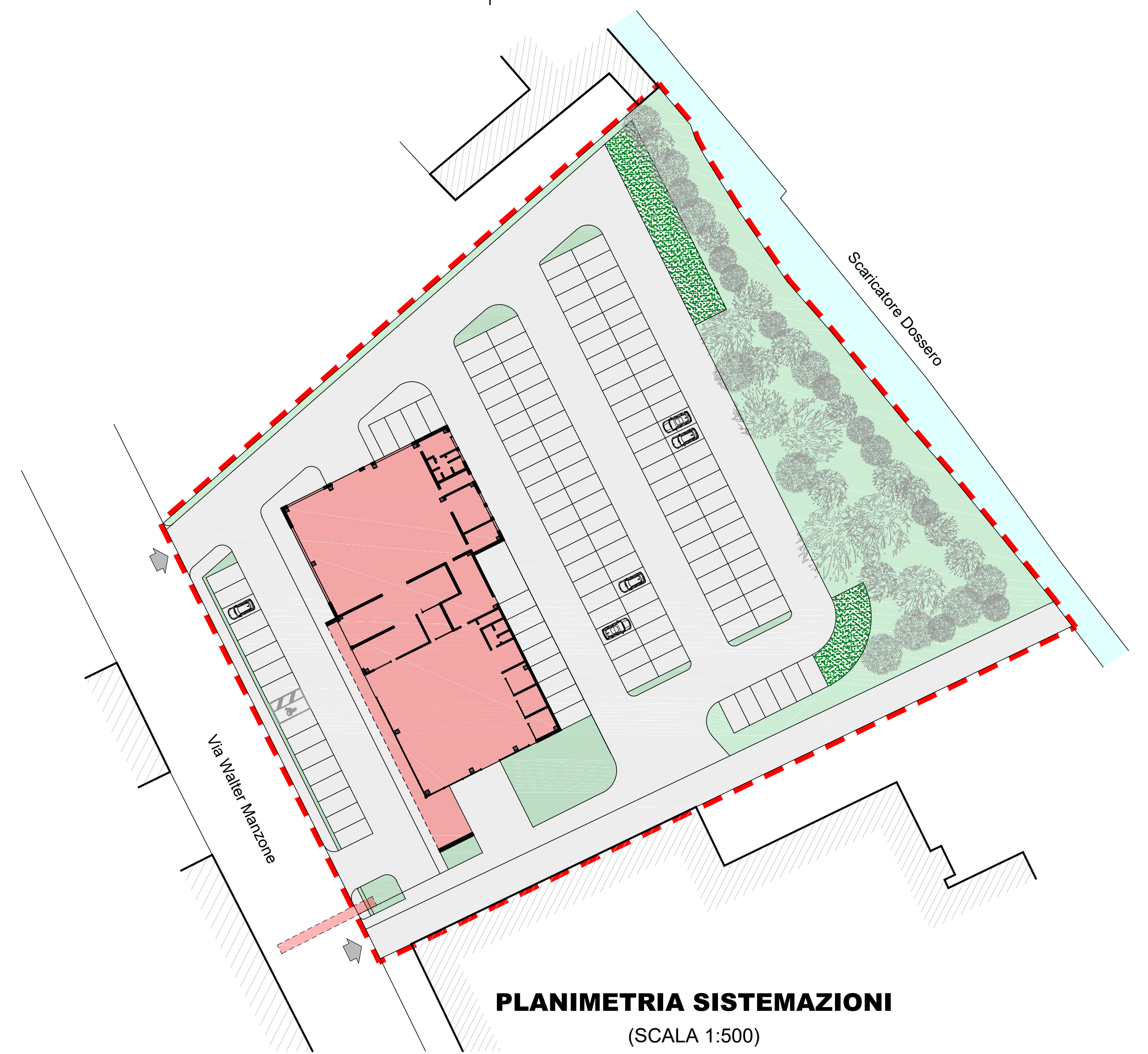
PLANIMETRIA SISTEMAZIONI (SCALA 1:500)