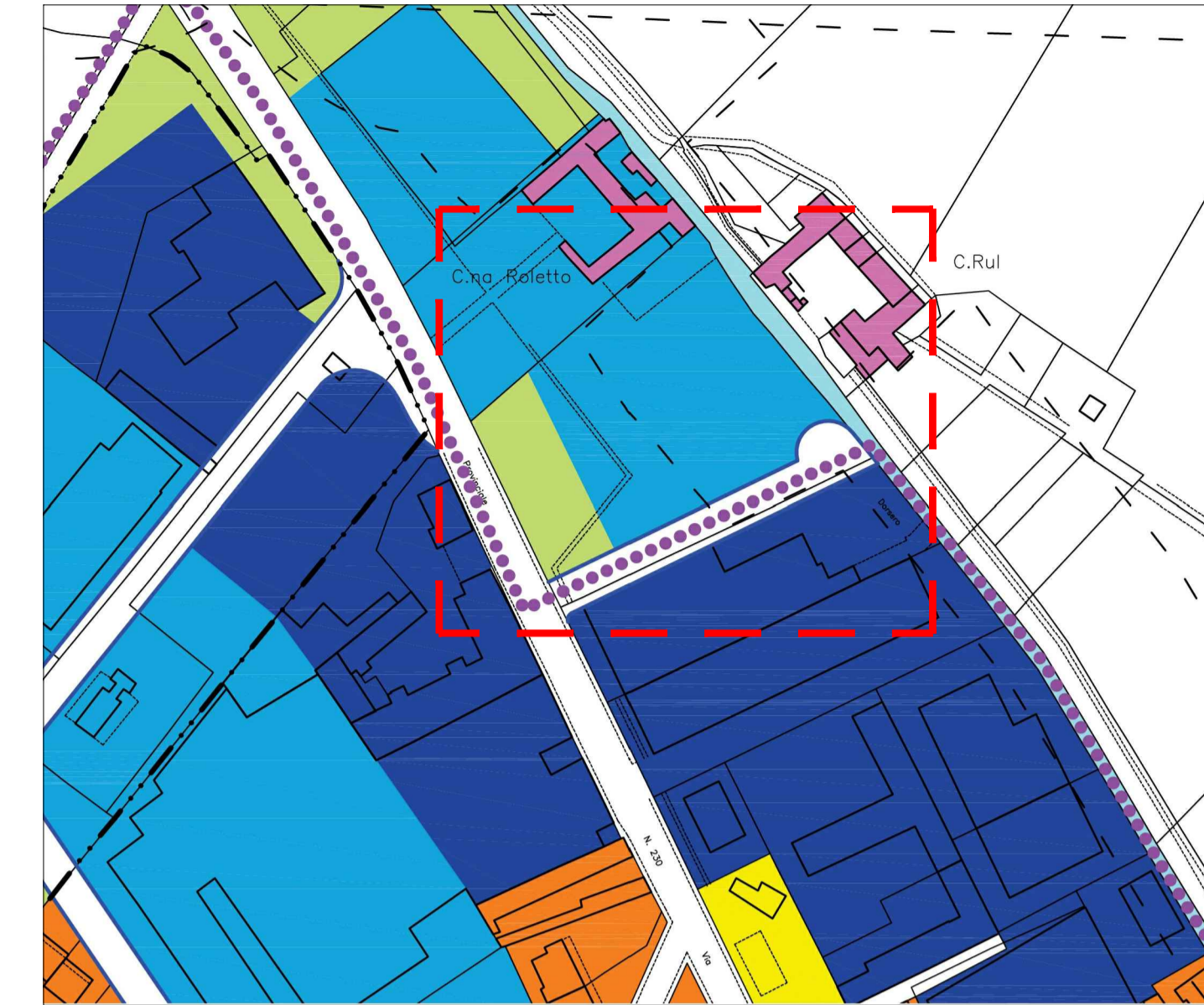
ESTRATTO DI PRG (SCALA 1:2000)